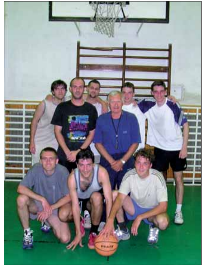
Egy kép 2004-ből

újra meg újra. És remélem, ez lehet követendő példa a mostani Deák-diákoknak is. Akiknek bátran merem állítani, hogy a Deák Ferenc Gimnázium mindannyiunk számára második otthonunk volt. A tanári kar mindig magas színvonalú oktató-nevelő munkája volt az alapja annak, hogy ma