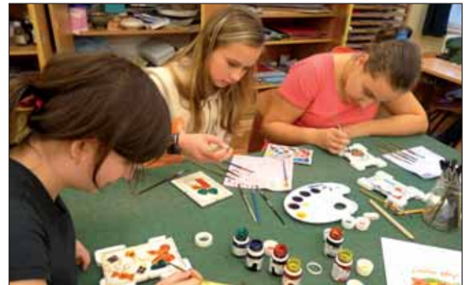
Alkotnak a lányok