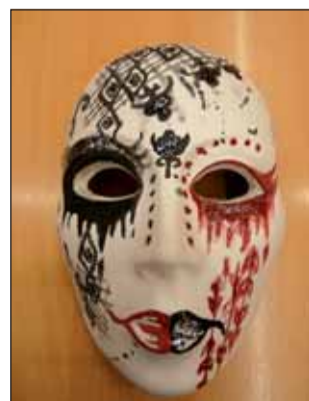
Egy szép álarc