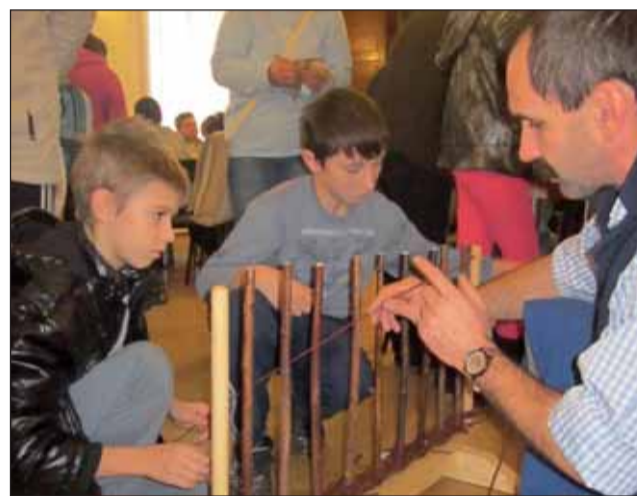
A kis kézművesek mesterükkel