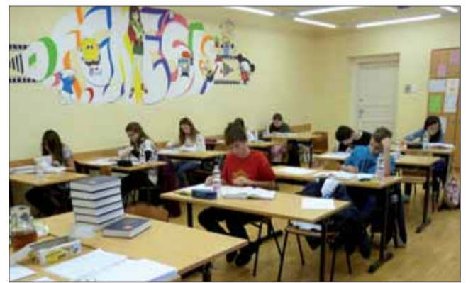
A fordítóverseny résztvevői

Egy másik teremben pedig az ügyes kezű fiatalok gyöngyöt fűztek, álarcot és üvegeképeket festettek. Kreativitásukat kibontakoztathatták, új technikákat ismerhettek