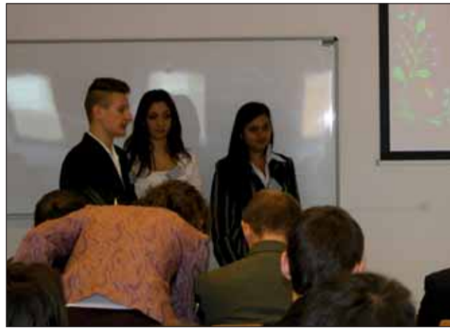
A közgazdasági versenyen szereplő diákok

Az első részben részletesen bemutattuk a kistérséget, természeti adottságait, demográfiai jellemzőit, gazdasági helyzetét, turisztikai kínálatát, kultúrtörténeti és építészeti emlékeit. A második részben ele-