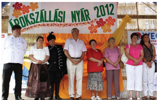
A jászkapitány és a „körülötte valók” a tribünön