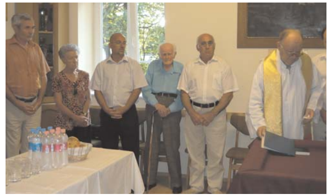
A felújított tűzoltó épület felszentelése

Az előző lapzárta óta eltelt időszak alatt 7 esemény történt (2 műszaki mentés, valamint 5 tüzeset). A július 11-i tüzesetnél 7 járművel történt a beavatkozás (Jászárokszállás