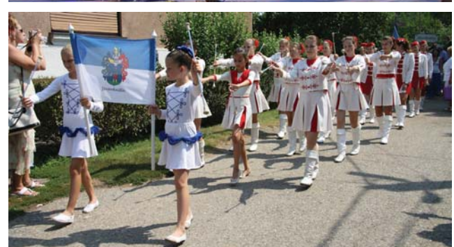
Kangoosaink és mazsorettjeink a világtalálkozóon