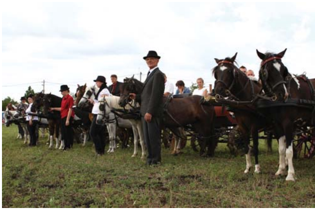
Köszöntés a verseny előtt

Ezt követően a fogatok tiszteletkört tettek a város főterén és néhány utcában. A versenypályára visszatérve a pónik versenyével megkezdődött az akadályhajtás,