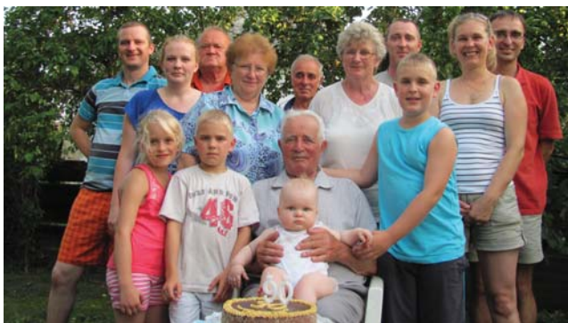
Az ünnepelt családi körben

Ünnepi torta két alkalommal került az asztalra, mivel a család – lányai, vejei, 3 unoka-