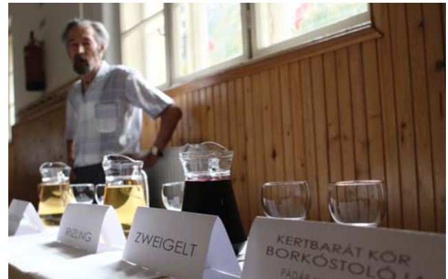
A Kertbarát Kör borköstölője

Birkához fűződő szájhagyományt is felidéz: A lakodalmi birka sikere a házasság sikere.