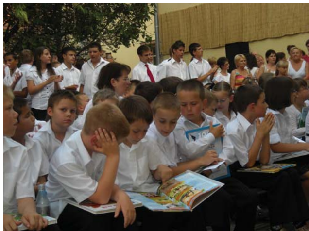
A legjobbak jutalmuk birtokában

hogy jó magatartásúak tanítványaink, mivel alsóban 62 %, a felsőben 49 % kapott példás magatartást. Tanítványaink körében érték a tudás, és fontosnak tartják a tanulást, így alsóban 58 %, a felsőben 35 % kapott példás szorgalmat. Nagy öröm, hogy a 64 nyolcadikos tanuló mind továbbtanul. A helyi gimnáziumba 29, szakiskolákba 18, szakiskolákba 17 tanuló nyert felvételt.