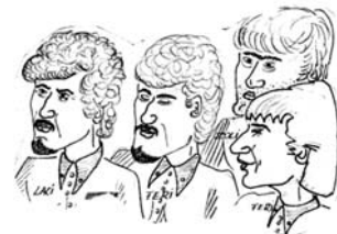
A jászárokszállási SIEMENS zenekar

A repertoárunk széles volt, mint a Balaton vize, azaz eklektikus, mint általában egybábi zenekaré. Játsszótunk „családalapító” lírai számokat éppúgy, mint lábdob szaggató kemény rockszámokat. Egy kis túlzással A-tól Z-ig, az Apache-tól a Zorro betétdaláig mindenfélét. Akkoriban még nem volt sok lehetőség. Nem volt internet, ahol ma