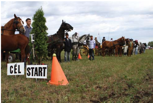
Türelmetlenül várva az indításra