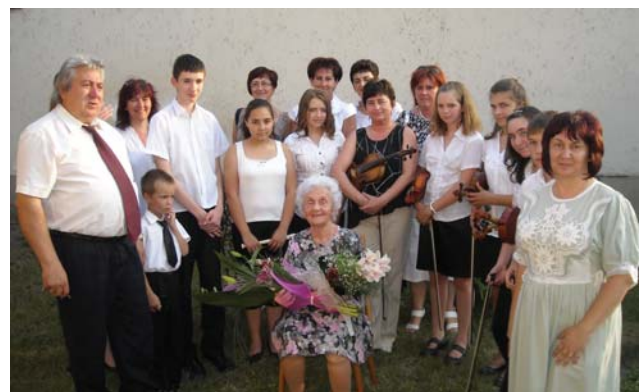
Icuka néni és a köszöntők

került a Szent Imre Általános Iskolába, néhány év után a Széchenyi István Általános Iskolába helyezték át, és nyugdíjba vonulásáig itt tanított. Egy-egy osztályban 48 fű volt, mert akkor 50 fő fölött bontották az osztályokat. Ezt a számot kimondani is sok, nem még megtanítani írni, olvasni, számolni. Icuka néni ennek a nagy kihívásnak mindig megfelelt, melyhez biztos hozzájárult a jutalom, az egyedi, az általa kitalált meleg érem, melyre minden kisdíjak nagyon vágyott és büszkeséggel töltötte el, ha a tulajdonosa lehetett. Volt év, mikor a felső tagozaton is kellett tanítania. Itt rajzot és magyart oktatott. Tanítványairól naplót vezetett, melyben gyermekszáji mondásait feljegyezte. Így lett ő 22 évesen öreg és 55 évesen fiatal a gyerekek szemében. Mit jelent e kettős elentet? A r betűt tanulták a gyerekek és ezzel kellett szavakat mondani. Öreg – mondta az egyik kisgyerek. De ki az az öreg? Hát a tanító néni – volt a válasz – aki akkor még csak 22 éves volt. És hogyan lett 55 évesen fiatal? A szülői értékekre az egyik kisgyerek