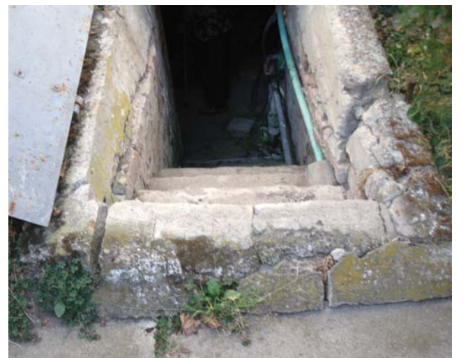
A néhai serház pince bejárata