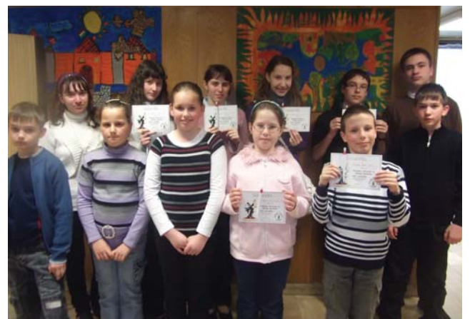
A Nyelvész nyertesek

Iskolánk környékéről összedték a szétdobált szemetet. Az összegyűjtött szemetet a szelektív hulladékgyűjtőbe rakták. Munkájuk közben megfogalmazták: ha nem dobjuk el, nincs mit összeszedni. Erre neveljük tanítványainkat.