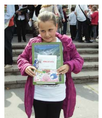
A matematika bajnoka