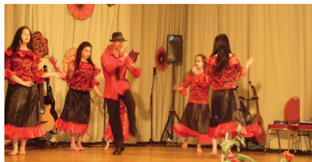
Jelenetben a Piros Pipacsok