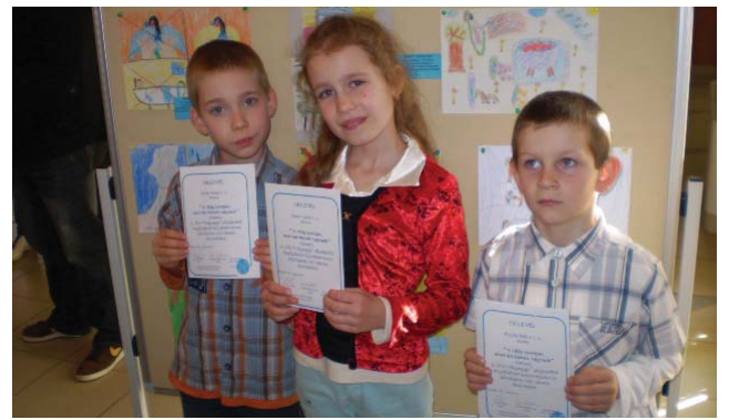
A „vizes” nyertesek