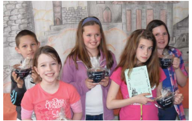
A „bétmértföldes” csapat

Április 22. a Föld napja. Alsós tanítványaink 23-án e naphoz méltóan zöld ruhában gyalog, kerékpárral, görkorsolyával jöttek iskolába, csatlakozva a felhíváshoz: „autómentes nap” legyen Földünk napja. Bolygónk kialakulásáról egy ismeretterjesztő filmet néztek meg. A megemlékezés során is hangsúlyozták verseikben, hogy tenni kell bolygónk megmentéséért. Ezt követően tettekkel is bizonyították, hogy fontos szerepük van már nekik is a mozgalmában.