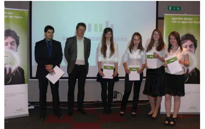
A Deák-Diák csapat tagjai az Magyar Nemzeti Bank képviselőivel

A Deák Ferenc Gimnázium, Közgazdasági és Informatikai Szakközépiskolából két csapat vágott bele a küzdelembe. Októbertől áprilisig zajlott a verseny. Az első négy hónapban havi egy alkalommal egy-egy 25 közgazdasági kérdésből álló tesztet kellett kitöltenünk. A sokszor becsapós kérdések ellenére mindkét csapat 97%-os teljesítményt nyújtott. A verseny szabályai szerint pontszám-azonosság esetén az a csapat juthatott a