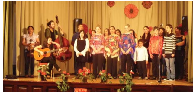
Cigány himnusz éneklése a Romano Glaszival