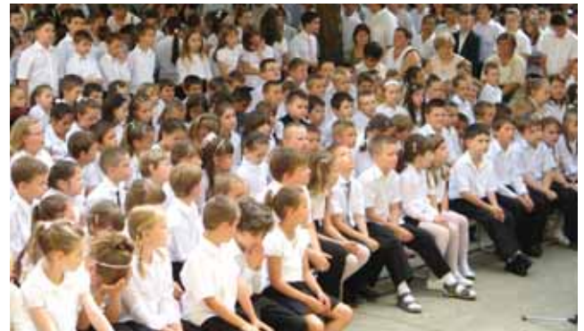
Vajon milyen lesz a bizonyítványom?