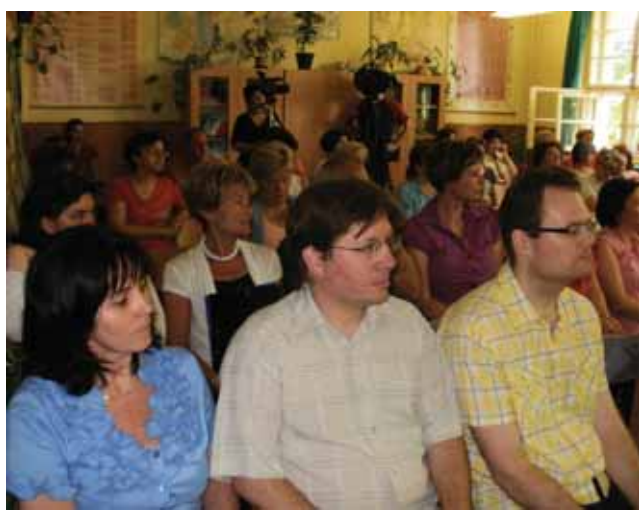
A résztvevők és a segítők

A pedagógusok felkészítő tanfolyamon vettek részt, (30 nevelő, két csoportban, 10-10 órában) ahol elsajátíthatták, illetve bővíthették ismereteiket az interaktív táblák