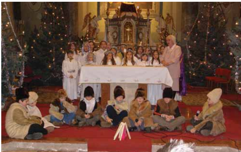
A gyerekek betlehemes játéka

Advent vasárnapjain a kilenc órai szentmise előtt az adventi koszorún meggyújtottuk a gyertyákat, amelyek a karácsony közeledtét jelképezik.