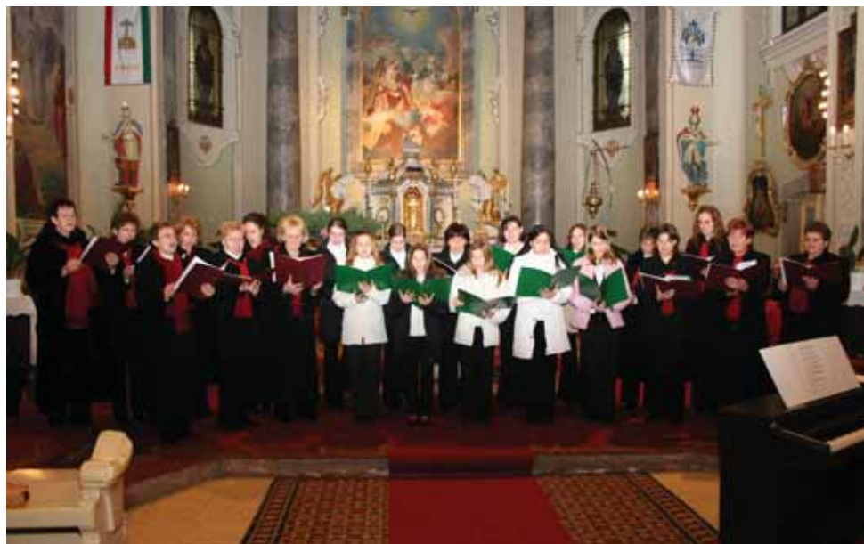
Együtt a felnőttek és a gyerekek