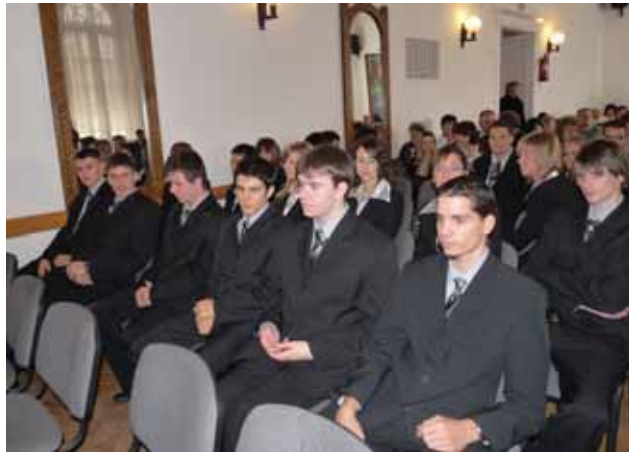
Végzős diákok 12/b