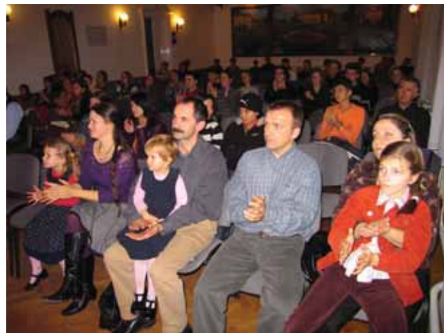
A zenekar játékát nemcsak a szervezők élvezték

A koncert után táncszállást vártuk a lelkes közönséget. Ma már ritkaságszámba megy élő zenére táncolni. Ráadásul nálunk a talpalávalót 3 dudu szolgáltatta, ami különösen jó hangulatot teremtett. A néphagyomány úgy tartja, András nap után elhalkul a muzsika, onnantól a karácsonyi szent születésig a csendes, magunkba szállt készülődés a főszerep. Akik ott voltunk,