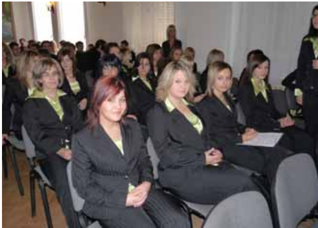
Végzős diákok 12/a