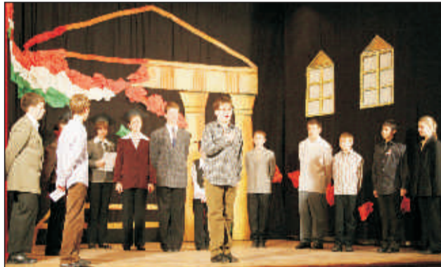
Forradalmi jelenet 1848-ból

most egyesülő Európában sem lehet megfelelő képviselő a megosztott pártharcoktól hangos, viszályokkal terhelt nemzetnek.