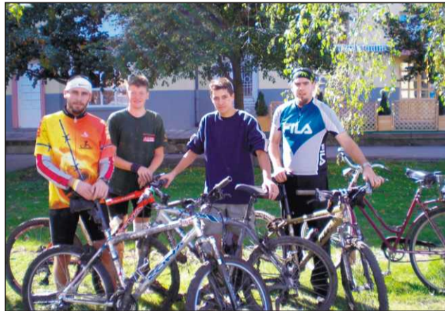
Akiket engedtek kerékpározni