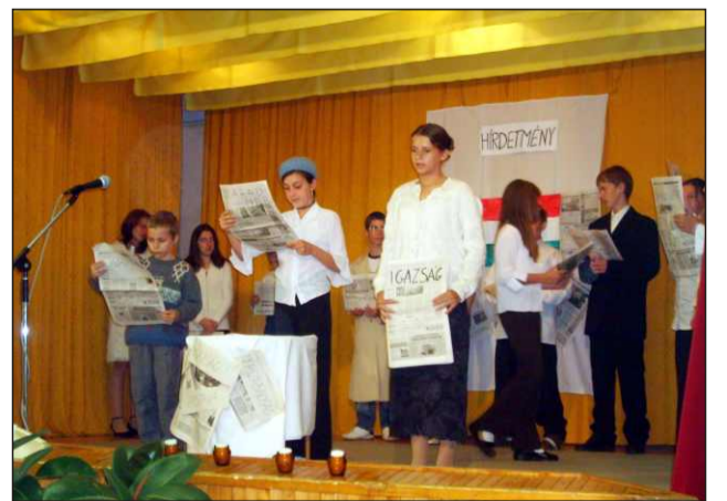
Az ünnepi megemlékezés mozgalmas pillanata

szöntő szavai és megemlékező gondolatai után az általános iskolások műsora következett. A felső tagozatos tanulónak köszönhetően a színpadon meglevendek az egykori események, méltóképpen tisztelegve és emléket állítva a történelem