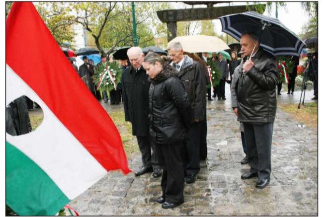
Az '56-os Szövetség koszorúja

A mai állapotokról egyértelműen fogalmaz. 1989-ben nem történt meg a rendszerváltás. Gengszterváltás történt. Ahelyett, hogy a közvagyon magántulajdonba átvigyék, 5 évre el kellett volna tiltani