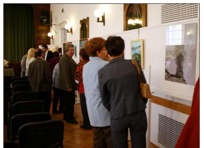
Az érdeklődők szép számmal tekintették meg a tárlatot