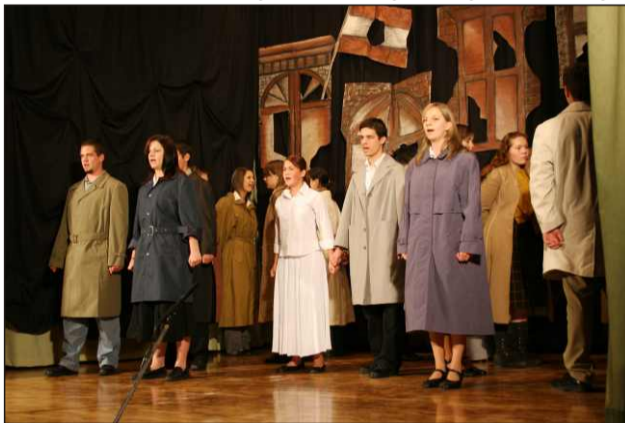
Részlet az ünnepi műsorból