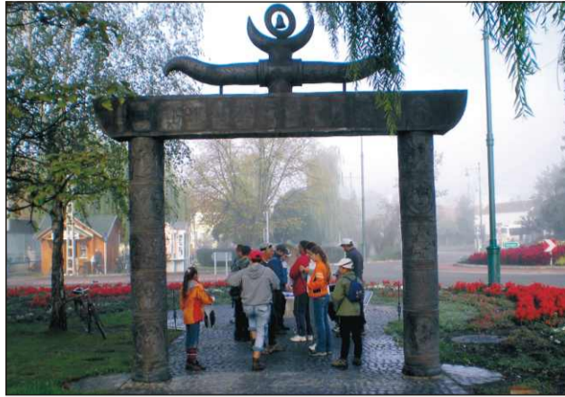
Indulás előtt a gyalogosok

Bánhatják! Igaz, hogy az ellenségeimnek sem kívánok ilyen ragadós sarat, de maga az öröm, hogy megcsináltam, megcsináltuk, feledtet