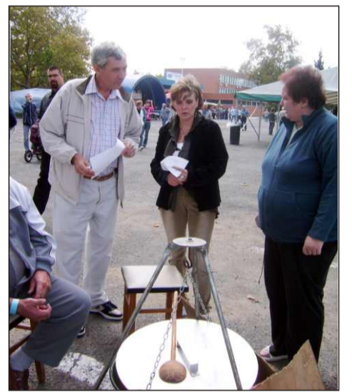
... majd ízlelhetik

A szervezők komoly kihívás elé néznek, ha jövőre felül akarják múlni az idei program sikerét.