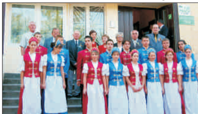
A tarlói küldöttség Fortunások és képviselőink a testvérvárosban