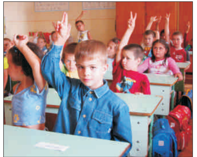
Első nap az iskolában...

Szeptembertől az óvodában és az általános iskola alsó tagozatában térítés nélkül étkezhetnek a rendszeres nevelési segélyben részesülő gyermekek. 50%-os térítési