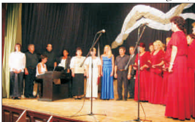
A Székely Himnusz éneklék a Gálaműsoron

Gálaműsorra tett javaslatot egyöntetűen elfogadták. Rögtön elkezdtük a szervezést, a feladatok elosztását. Rövid idő állt a rendelkezésünkre, de úgy gondoltuk, a segítségre most, minél hamarabb van szükség.