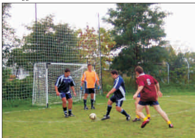
A kezdő rúgáson túl...