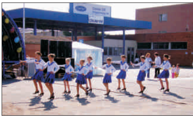
Mazzorett bemutató a családi napon