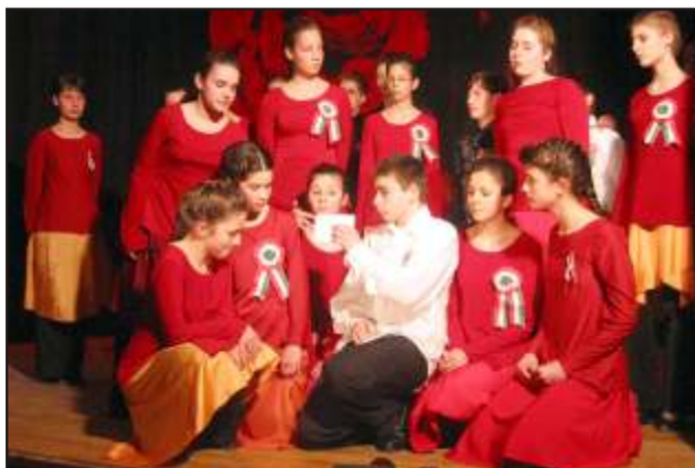
Jelenet az ünnepi műsorból