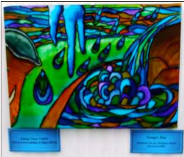
A díjnyertes üvegfestmény

A díjat március 23-án Szolnokon a Napsugár Gyermekkorházban vehette át a Közép-Tisza Vidéki Környezetvédelmi Felügyelőség képviselőjétől. Gratulálunk!