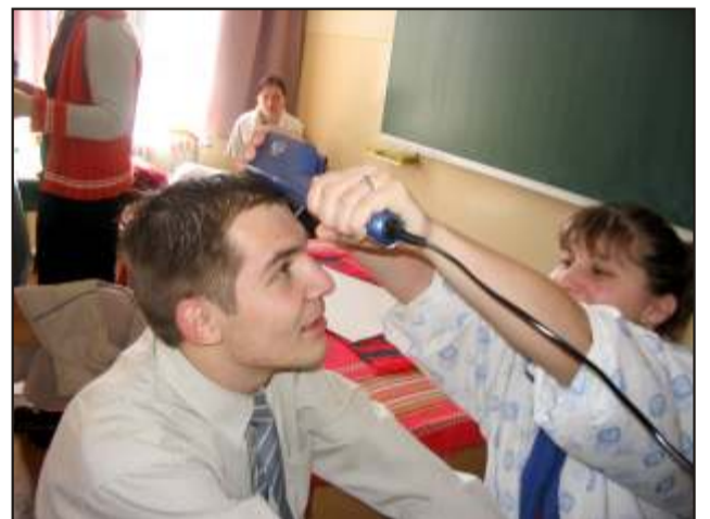
Az egyetlen napra megnyílt szépségszalomban még a diákigazgató is új frizurát kapott.