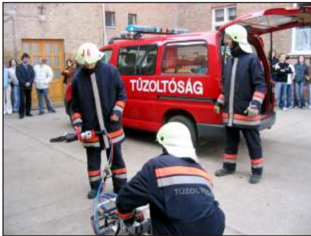
Tűzriadóval indult a nap. A kivonuló helyi tűzoltók a frissen megválasztott diákigazgatót mentették ki az épületből. (Köszönjük a tűzoltóknak a bemutatót!)