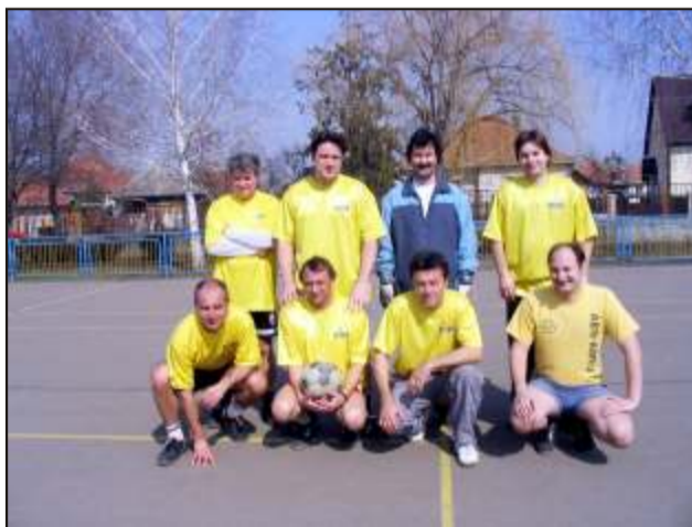
A nap során röplabda és foci házbajnokság is zajlott. A képen a tanári focicsapat látható.