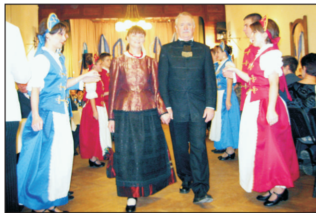
A Jászkapitány és felesége bálba érkezik