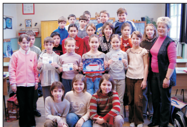
A 4.a osztály az okhívéllal

Gratulálunk a 4.a osztálynak, akik nemcsak szép eredményt értek el, hanem munkájukkal egy nemes célt szolgálva sok beteg gyermeknek szereztek örömet, boldogságot.