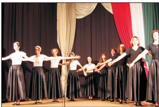
Jelenet a műsorból