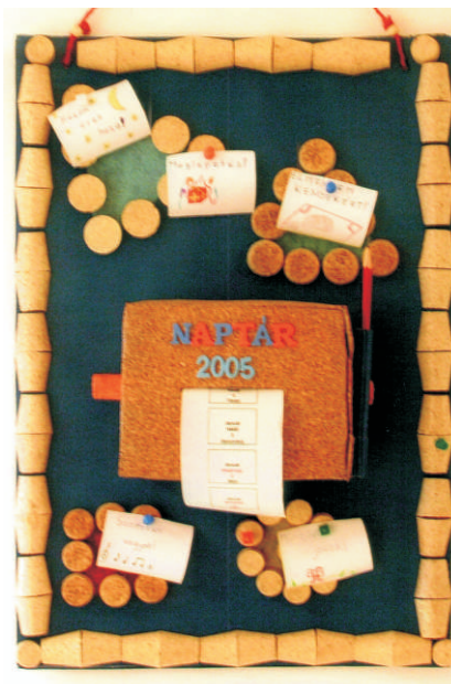
A nyertes pályamunka

Gratulálunk a 4.a osztálynak, akik nemcsak szép eredményt értek el, hanem munkájukkal egy nemes célt szolgálva sok beteg gyermeknek szereztek örömet, boldogságot.