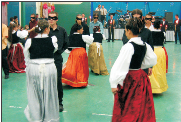
Lovagi tánc