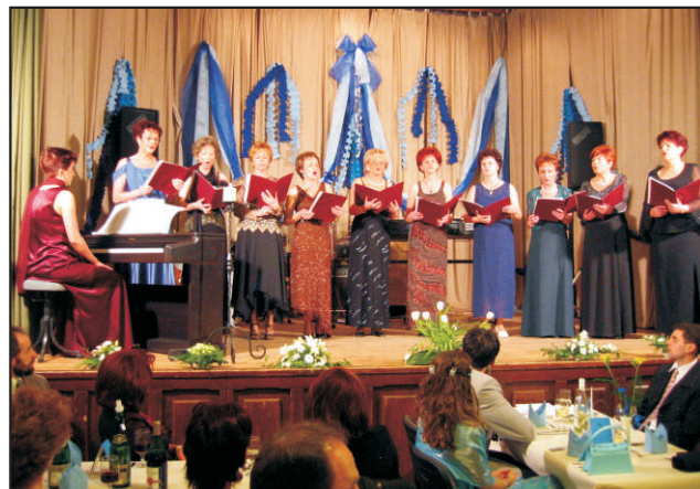
Árokszállási Óvónők Kamarakórusa