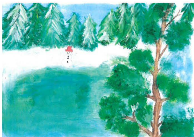
Bakró Linda rajza

A kihívásokat sikeresen teljesítő, félelem nélküli Boldog Új Esztendőt kívánok Fülöpkab Község Önkormányzata nevében!