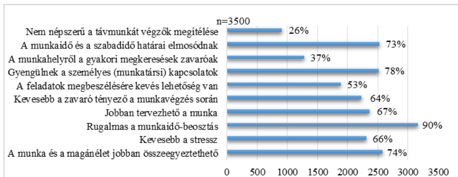
3. ábra. A 15–74 éves alkalmazottak aszerint, hogy egyetértenek-e az alábbi állításokkal a távmunkavégzést illetően, 2018. I. negyedévé vizsgálva, százalékban kifejezve