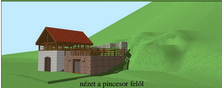
nézet a pincesor felől