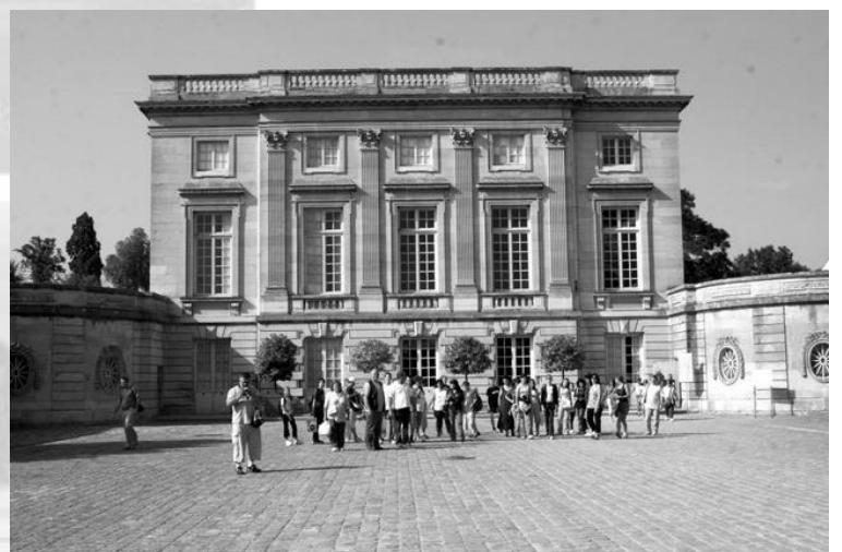
Kis Trianon előtt