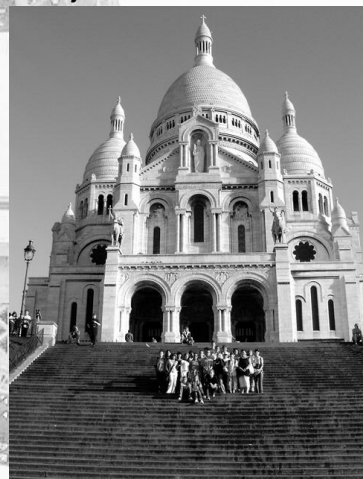
A Sacré-Coeur lépcsőin

3. Nap: Disneyland. Amikor odaértünk esni kezdett, és úgy tűnt, hogy ez így is marad. Szerencsére kegyes volt hozzánk az ég, és mire a vadnyu-