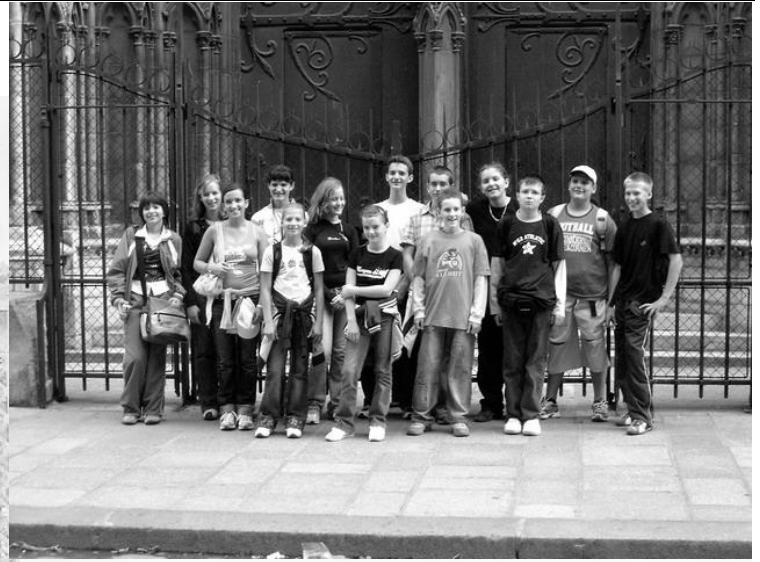
A gyerekek a Notre-Dame oldalkapujánál

fooglalkozott a francia főváros nevezetességeivel, közlekedésével, szeptemberi kulturális eseményeivel azért, hogy erre az öt napra otthon