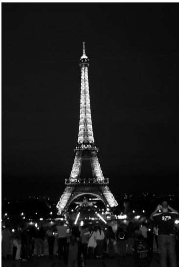
Az Eiffel-torony esti fényben