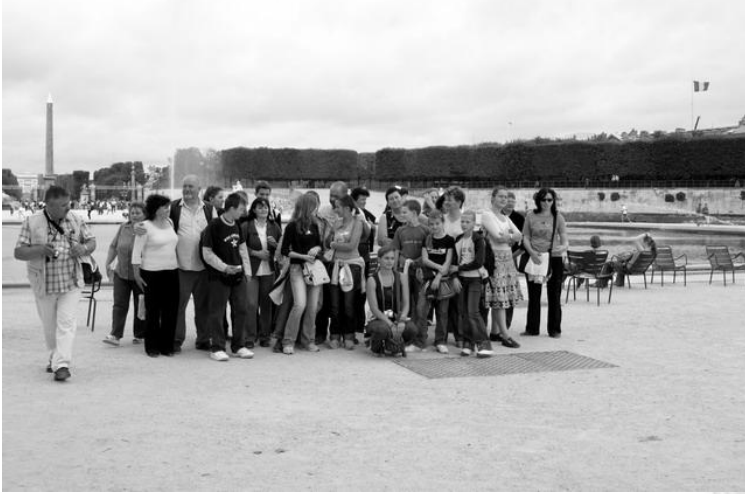
Csoportkép a Tuileriák kertjében

gati vonattal körbe jártuk a parkot, az eső is elállt. A nap többi részében szó szerint felhőtlenül élvezhettük a jobbnál jobb játékokat, és a délutáni látványos felvonulást. Egészen biztos, hogy ez volt az évszázad legrövidebb napja – legalábbis mi úgy éreztük. Ezen a helyen mindenki láthatja, hogy vannak emberek, akik soha nem nőnek fel igazán, és a végletekig komolyan veszik azt a világot, amit a mesékben a gyermekek számára teremtetek. Kár, hogy ilyen messze van, mert ide minden gyereknek el kellene jönnie egyszer.