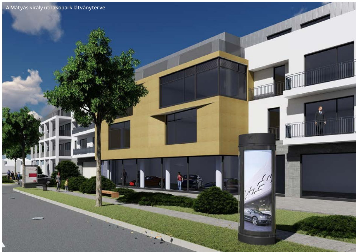
A Mátyas király uti lakópark látványterve