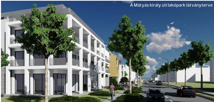
A Mátyas király uti lakópark látványterve

Új építésű okosotthonokkal, és egy minden ízében 21. századi 63 lakásos belvárosi társasházzal pezsdítene fel Kazincbarcika ingatlanpiacát a Green Plan Energy Kft., amely hagyományos napelemgyártással és telepítéssel foglalkozik, az utóbbi években azonban portfóliójukat kiterjesztendő energiatakarékos otthonok építésével is foglalkozni kezdtek.