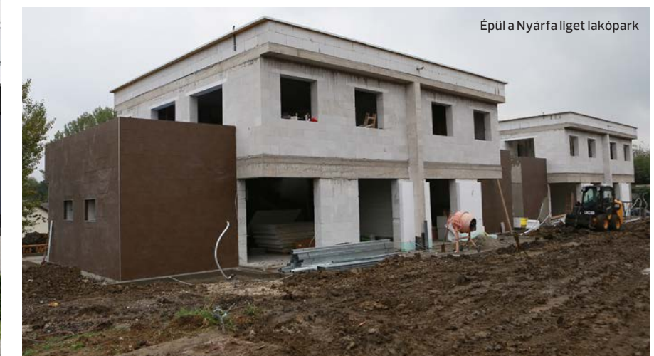
Épül a Nyárfa liget lakópark

ruházást kíván megvalósítani két ütemben a cég, melynek révén akár száz embernek biztosíthat az üzem új munkahelyeket. Az előttünk álló három év alatt egy logisztikai központot, valamint egy új gyárcastronokot terveznek építeni, melyben az általuk tervezett napkollektorok gyártását végzik majd. A most bejelentett építkezések pedig várhatóan újabb és újabb munkahelyeket hoznak majd létre a városban és vonzáskörzetében, arról nem is beszélve, hogy végre lehetőséget kínál az érdeklődőknek, hogy új építésű társasházakban kössenek le majd maguknak lakásokat, amelyek várhatóan 2022-re kerülnek majd kulcsra-kész állapotban átadásra.