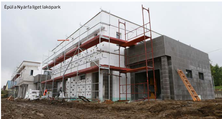
Épül a Nyárfa liget lakópark