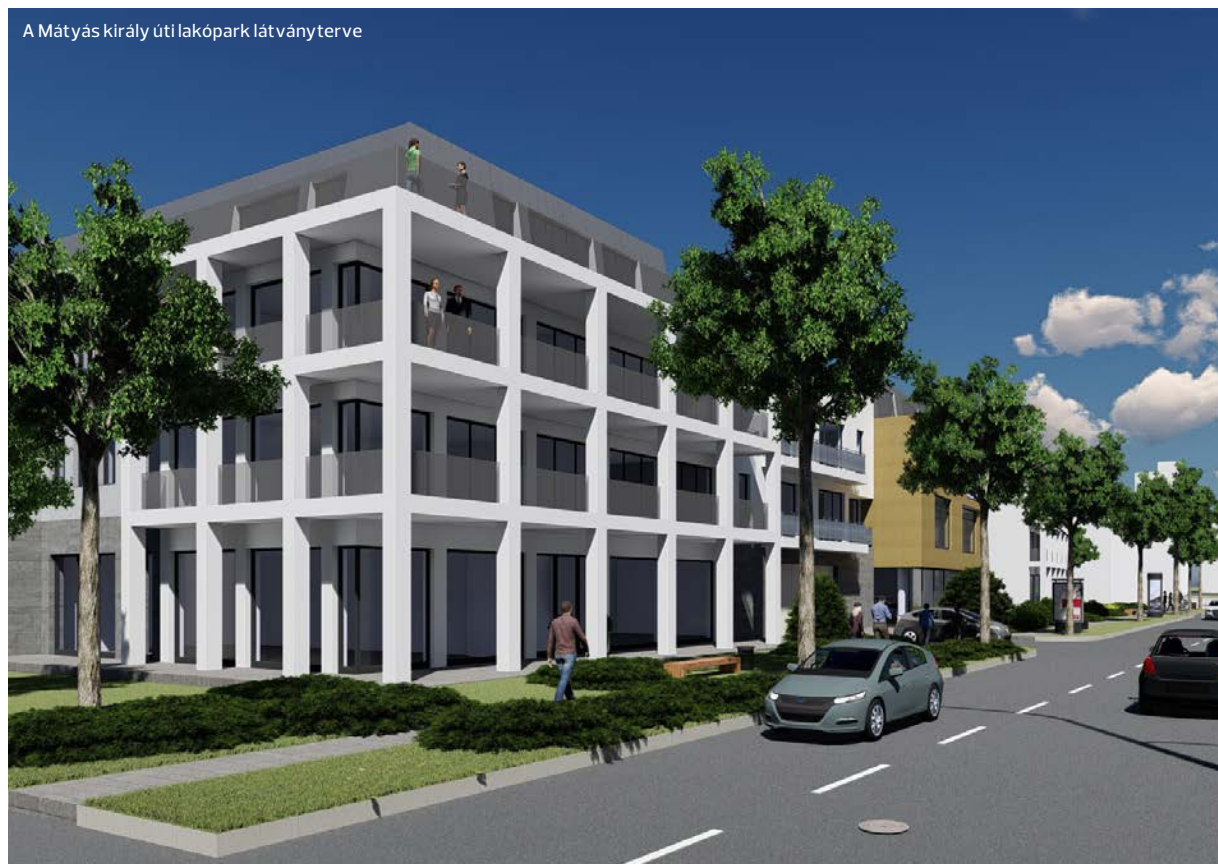
A Mátyas király uti lakópark látványterve

szem előtt tartja – hangsúlyozta a városvezető bevezetőjében. A Green Plan Energy Kft. tulajdonosai immár 20 éves vállalkozói karrierjük alatt jó pár évet eltöltöttek építőipari kivitelezések menedzselésével, így nem kellett anulláról felfedezve elindulni a területen. A cég már meglévő korábbi kapcsolati hálójára támaszkodva, új építésű modern társasházakba kezdte beépíteni a saját kapacitásában legyártott napelemes rendszereit. Jelenleg egy ilyen társasház építése zajlik a Nyárfa