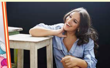
PALYA BEA ÉS ZENEKARA