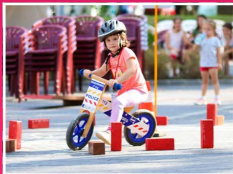
A Kreatív Kuckó 10 napon keresztül kézműves foglalkozásokkal, bemutatókkal, koncertekkel biztosított felhőtlen szórakozást kicsiknek és nagyoknak egyaránt