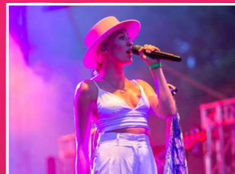
Igazi könnyűzenei csemegé volt a Blahalouisiana, majd az őket követő Wellhello fergeteges koncertje a fesztivál nagyszínpadán