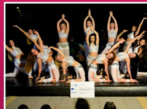
A táncművészet is helyet kapott az összművészeti fesztivál palettáján