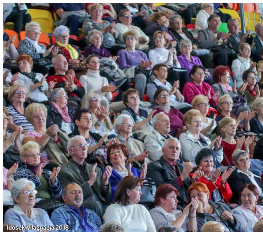
Idősek Világnapja 2018