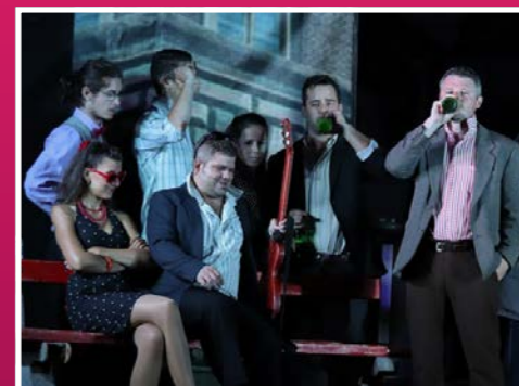
A MagyaRock Dalszínház elhozta a Hungária örökzöld slágereit Sajóivánkára

A RENDEZVÉNY FŐ TÁMOGATÓJA: KAZINC BARCIKA VÁROS ÖNKORMÁNYZATA