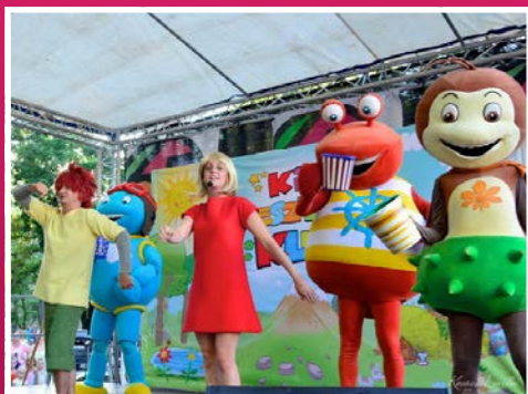
A Kicsi Gesztenye Klub és az Iszkiri zenekar fantasztikus műsorral varázsolt igazi fesztiválhangulatot a legkisebbeknek is