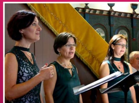
A MusiColore Énekegyüttes nevében is igazán passzolt a színes városhoz