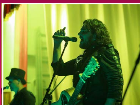
igazi ír kocsmahangulatot teremtett a Paddy and the Rats összetéveszhetetlen zenéjével