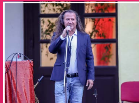
Szent Martin a nyár ölelésében váltotta valóra a közönség álmait