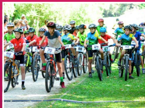
Borsod MTB Bajnoka 2019-ben a fesztivál sportprogramjait színesítette