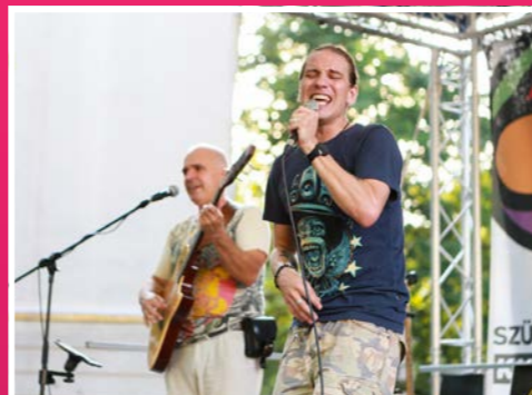
A kifli nem csak péksütemény – tudhattuk meg az azonos nevű zenekar koncertjén