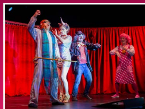
A L'art pour l'art Társulat Mintha elvágta a című produkcióján szem nem maradt szárazon