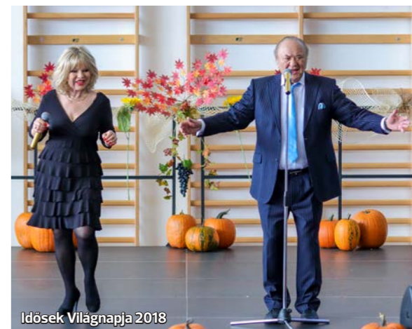
Idősek Világnapja 2018