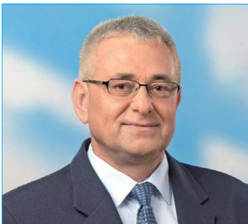
Demeter Zoltán országgyűlési képviselő

A választásokon elsődlegesen a lakcíme szerinti szavazókörben szavazhatnak. Az egyes választástípusokhoz kapcsolódóan azonban különböző lehetőségek vannak, ha máshol (másik szavazókörben) kívánnak szavazni, illetve amennyiben fogyatékos-sággal él vagy mozgásában korlátozottak.