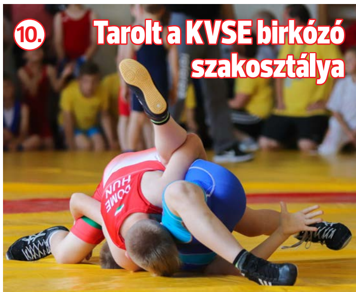
10. Tarolt a KVSE birkózó szakosztálya