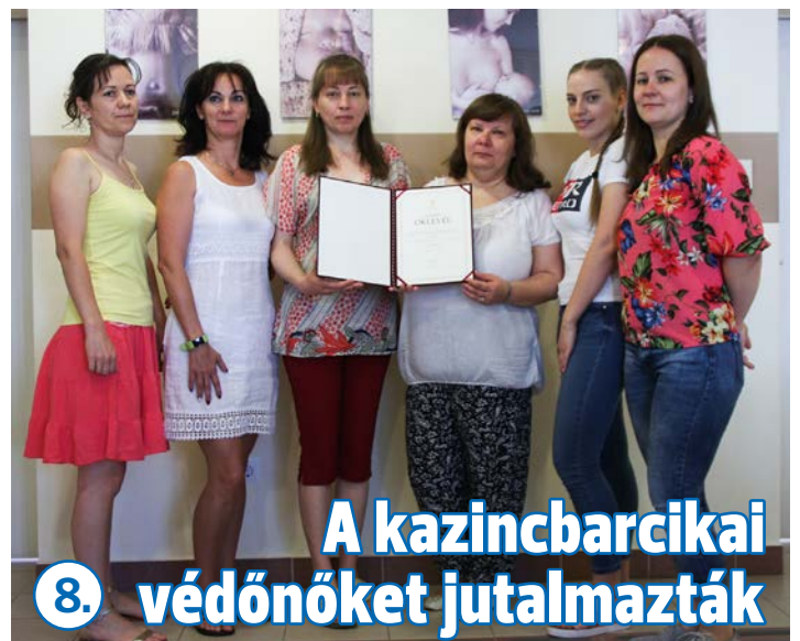
8. A kazincbarcikai védőnőket jutalmazták