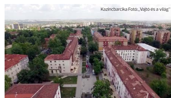
Kazincbarcika

lődése, népszerűsége – és nem csak az itt lakók körében, hanem országosan is – az emelkedő imázsa. Egyre több média mutatja be a várost, ami vonzza a településre a látogatókat. Van jó pár olyan esemény is, amire nemcsak a kelet-magyarországi régióból, hanem a Dunántúlról is visszajárnak a vendégek. Tehát így, a 65 éves évfordulón kijelenthetjük, hogy Kazincbarcika csak útelágazáshoz ért... Hogyan ünnepelték a város 65. évfordulóját? Természetesen csak kiragadott példákat sorolhatok fel a cikk rövidsége miatt. 1954 és 1989 között jellemzően egy-egy szociális, közellátó, oktatási intézmény, valamint park átadásával ünnepelték meg az eseményt. (Például: Kun Béla Általános Iskola, Kazinc Áruház, Fő téri Park, Jubileumi Park, Csó-