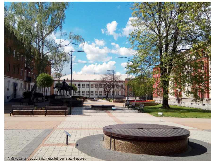
A Rákóczi tér. Jobbra az F épület, balra az N épület.