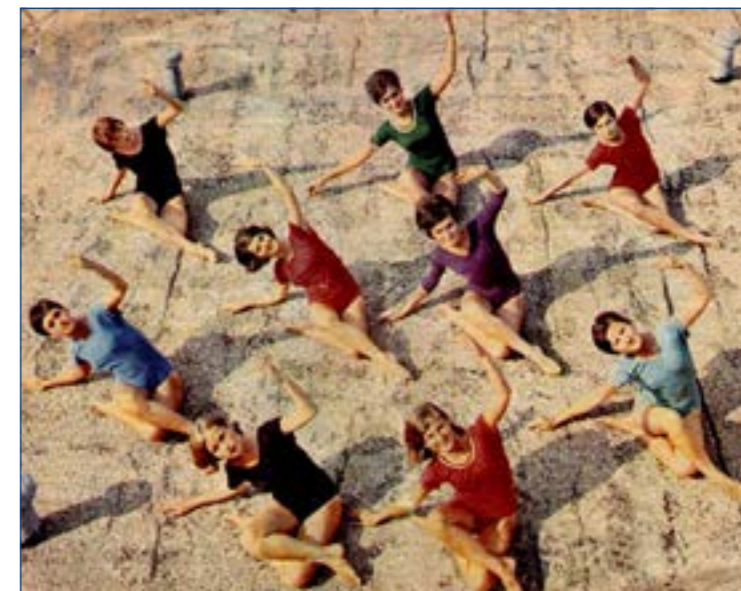
1967-ben a színes Nők Lapja is írt erről a remek csapatról