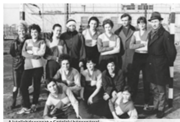
A kézilabdacsapat a Széplaki házaspárral