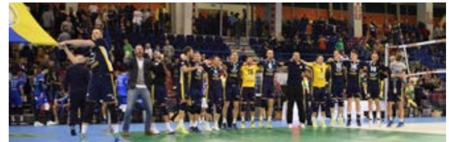
A VRCK 2018-as röplabdacsapata legújabb kupagyőzelmét ünnepli