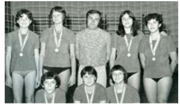
A Kun Béla Általános Iskola 1979-es röplabdacsapata