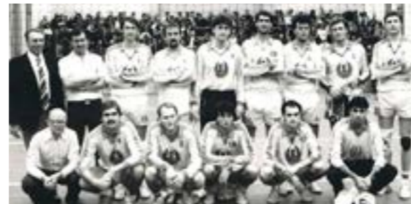
A KVSE 1989-es röplabdacsapata