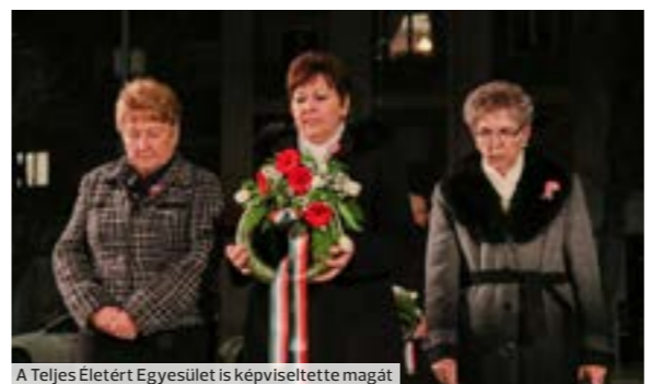
A Teljes Életért Egyesület is képviseltette magát