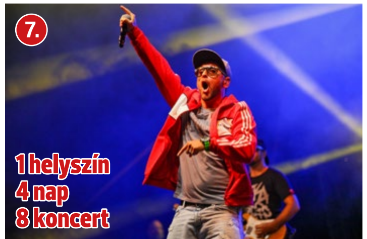
1 helyszín 4 nap 8 koncert