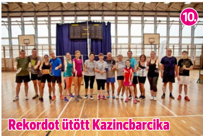
Rekordot ütött Kazincbarcika