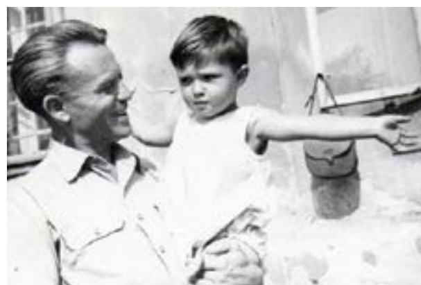
Apa és fia