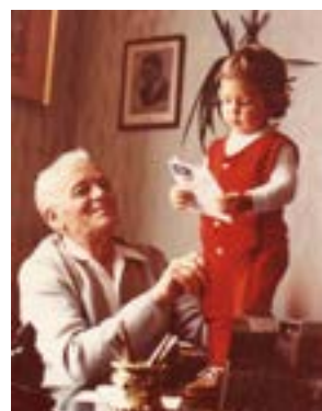
A boldog nagyapa