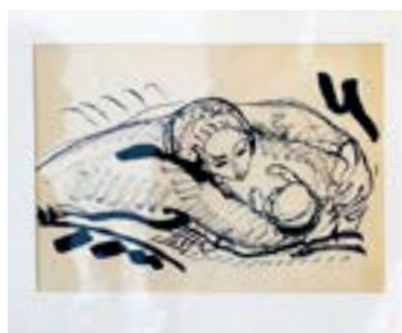
A negyvenéves gyűjtőszemvédelly darabjait május 26-ig tekinthetik meg a látogatók.