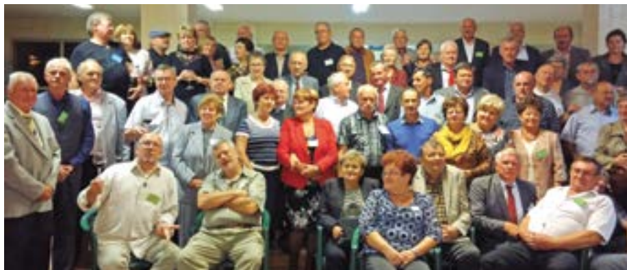
a Csillagok Alatt Klub tagjai

ik – akik közül sajnos sokan már nem tudtak eljönni – kitörölhetetlen nyomot hagytak személyiségük fejlődésében. Szívesen emlékeztek vissza a városra, melyhez legszebb éveik kötődtek, s örömmel tapasztalták, hogy mennyit fejlődött, szépült Kazincbarcika. Mindig büszkék voltak arra, hogy irinyis diákok voltak, ápolták kapcsolataikat osztály- és évfolyamtársaikkal, érdeklődéssel követték az alma mater sorsát. Azt kívánják az iskola jelenlegi tanulóinak, hogy ők is éljék át ezeket a közösségi élményeket, fordítsanak gondot tanulmányaikra, hiszen későbbi boldogulásuk nagymértékben függ ettől. Legyenek büszkék arra, hogy ebben az intézményben tanulnak, vigyék tovább az iskola jó hírét, s 50 év múlva olyan szeretettel találkoznak iskolatársaikkal, ahogy a mai hatvanasok tették 2016. szeptember 24-én.