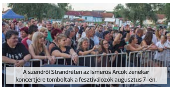
A szendrői Strandréten az Ismerős Arcok zenekar koncertjére tomboltak a fesztiválzókat augusztus 7-én.