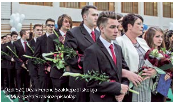
Ózdi SZC Deák Ferenc Szakképző Iskolája és Művészeti Szakközépiskolája

A „Válogatás a 60 év munkáiból” című tárlat május 27–éig tekinthető meg.