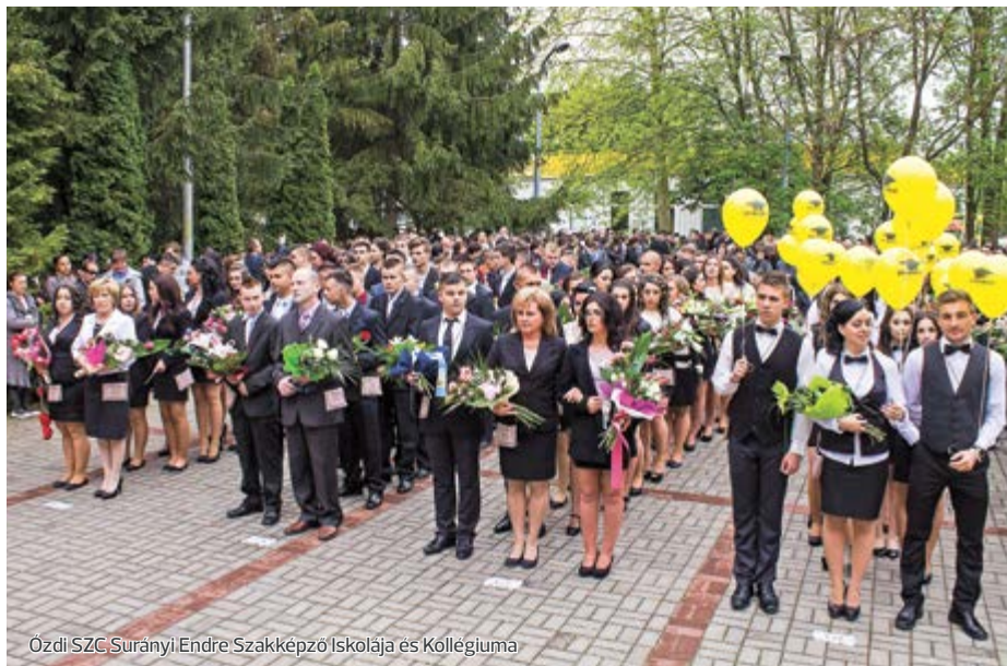
Ózdi SZC Surányi Endre Szakképző Iskolája és Kollégiuma

A ballagásokat követően május 2–án, hétfőn megkezdődtek az idei írásbeli érettségi vizsgák.