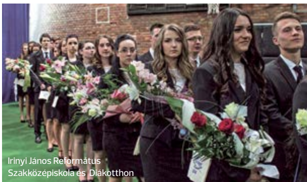
Irinyi János Református Szakközépiskola és Diákotthon