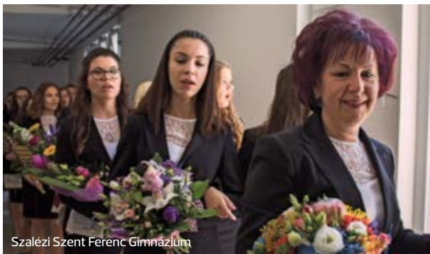
Szalézi Szent Ferenc Gimnázium