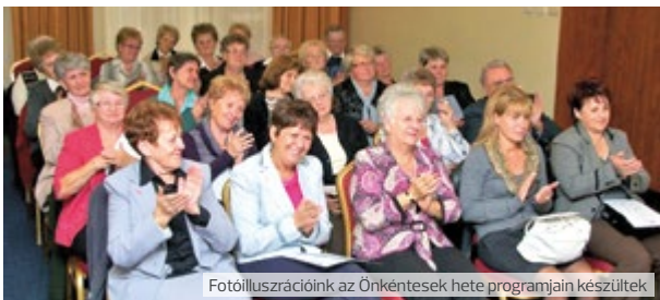
Fotóillusztrációink az Önkéntesek hete programjain készülték