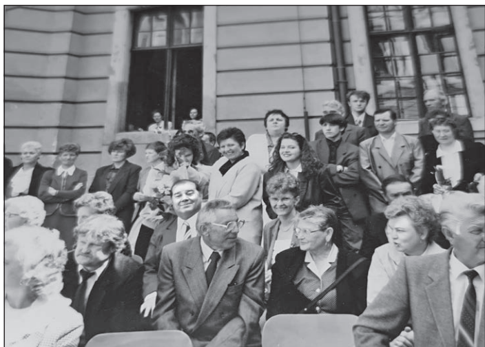
Az én diplomaosztómon Egerben 1994-ben, együtt a család