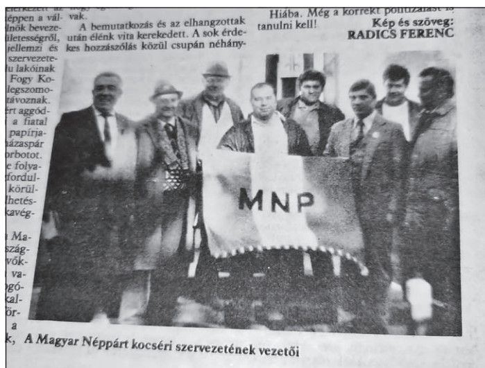
A Magyar Néppárt alapító tagsága

megbeszélni a költözés részleteit, apukám és anyukám elbeszéléséből pedig tudom, hogy mekkora változás volt a városias, barátságos Kocsér az előző körülmények után.