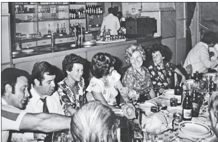
Pedagógusok között édesanyámmal