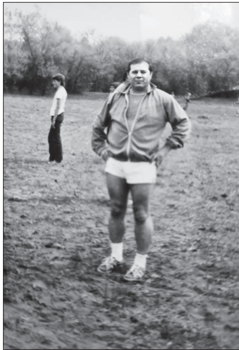
Édesapám fiatalon a Faragó-erdőben, május elsején, focimeccs előtt

Milyen ember volt? Mindenekelőtt erős egyéniség, megosztó személyiség, igazi közéleti, közösségi ember. Éleslátó és őszinte. Megnyugtató szavú, de olykor hangos. A betegeiért mindenre kész, a rendelő fejlesztéséért bármire