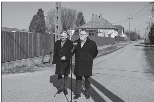
Földi László a térség országgyűlési képviselő és Hriagyel Csaba polgármester köszöntő beszéde

A pozitív támogatói döntésről szóló értesítést 2018. november 27-én küldte meg a Magyar Államkincstár. A Támogatási Szerződés 2019. február 8-án lépett hatályba.