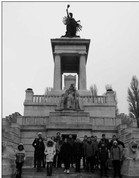
A Kossuth-mauzóleum lépcsőjén