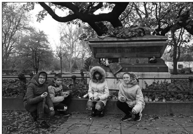
Arany János – tölgyek alatt nyugszik

ágyúöntő műhelye, és fegyverbemutató keltette fel az érdeklődésüket.