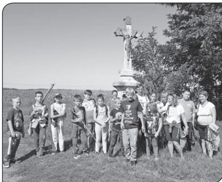
A Mihályi-kereszt tövében