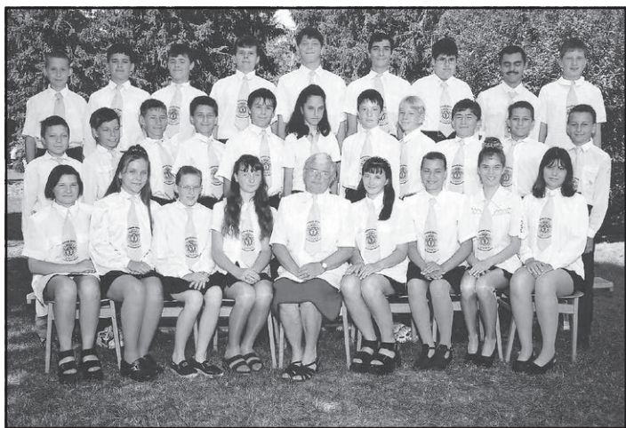
Ballagó diákjai között 2001-ben