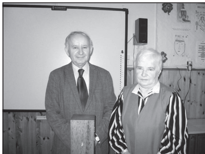
2017 őszén a kocséri iskolában dr. Ádám József akadémikus társaságában Tanyasi iskolából indulva lettek a matematika mesterei

szava, egy csipős megjegyzése, egy rosszindulatú észrevétele nem volt senkire. Se kollégára, se szülőre, se gyerekre. A főnökeihez lojális, a társaival kollegiális, a gyerekekkel következetes volt. Tudott szigorú is lenni, ha azt látta jónak, de indulatos, és főként rosszindulatú sosem volt. Tudta azt is, hogy ha egy diák nem is fogja fel a szóveges egyenletek megoldási módját, attól még dolgos, becsületes emberré válhat.