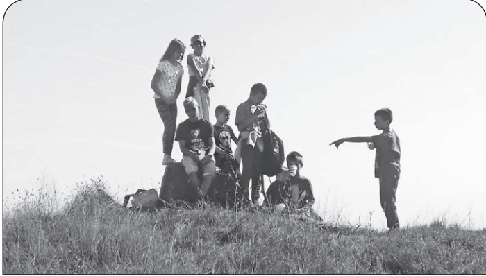
Sárhalom – kunhalom és hármashatár

Szeptember 21-én szombaton reggel 8-kor 22 iskolás diák indult neki, hogy körbekerülje Kocsért. Na jó, félig. Keletre indulva jutottak el a tiszakécskei határig, majd északnak fordulva a Kutyakaparó csárdánál jót ebédeltek, aztán a Kőrös-ér mentén haladva tovább a nagykőrösi mezsgyén jutottak vissza este 6-ra Kocsérra.