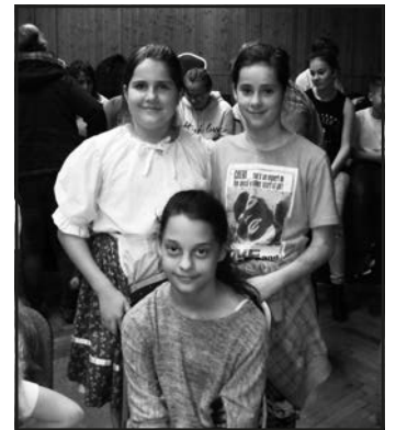
A hajfonó verseny kocséri résztvevői