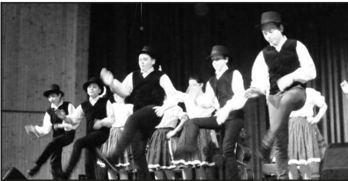
A kocséri legények osztják a csapásokat

A zenét Tormási Elek és barátai szolgáltatták, de besegítettek többször a citerazenekarok is.