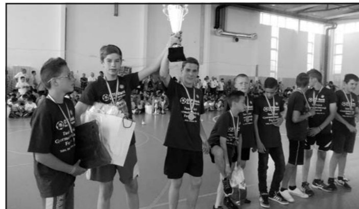
Ezért a pillanatot megérte küzdeni!