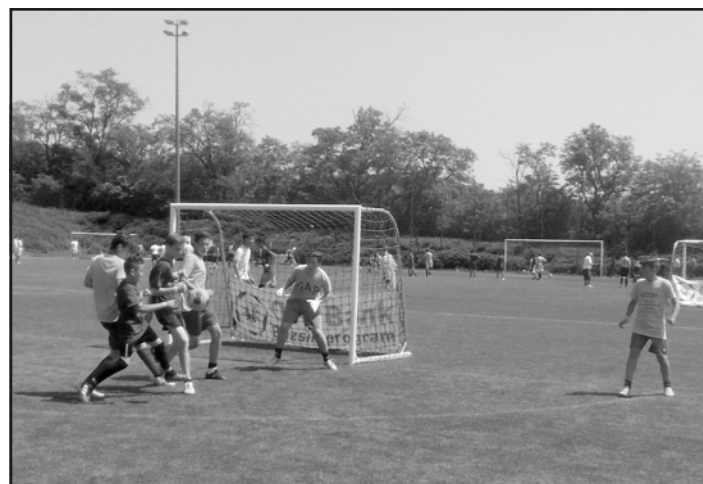
Ádáz küzdelem a műfüves pályán.

A remek körülmények között, neves vendégek jelenlétében (Mészöly Kálmán, Nyilasi Tibor) lezajlott torna felejthetetlen élmény marad a fiúknak, s e mellé még egy hatalmas kupát és sok-sok ajándékot is nyertek.