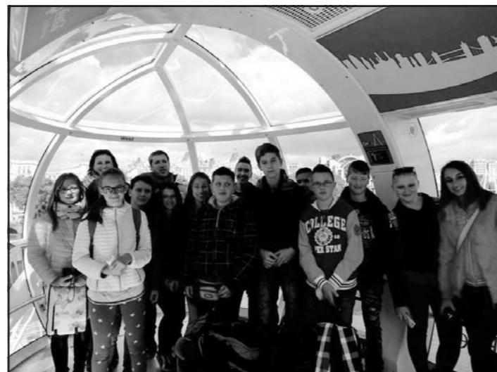
London a lábaink előtt – a London Eye-on

135 méter magasból tekinthettünk le a Big Benre (később kiderült, hogy ez igazából Elizabeth Tower) a London Eye-ről. Hatalmas élmény volt számunkra. ☺