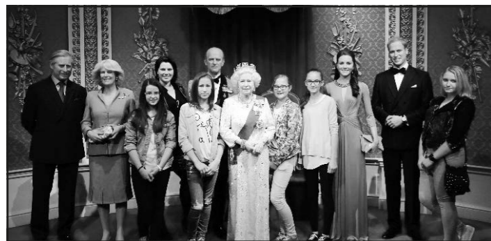
A híres panoptikumban a királynővel

Kora reggel a kikötő felé vettük az irányt, és a Csalagúton átkeltünk a tenger alatt. Angliába érve először a doveri fehérsziklát és a doveri várat nézhettük meg. És belekóstolhattunk az angliai „fordított” közlekedésbe is. Innen indultunk Canterburybe. Itt felkerestük a katedrális, és szabadprogram keretében szuvenirvásárlásra is volt lehetőségünk. A programoknak még mindig nem volt vége, mert az aznapi program keretében még a gyönyörű Leeds kastélyba is ellátogattunk. Este már a végleges szálláshelyünkön, egy mobil home parkban aludhattunk, Allhallowsban, a Temze torkolatánál.