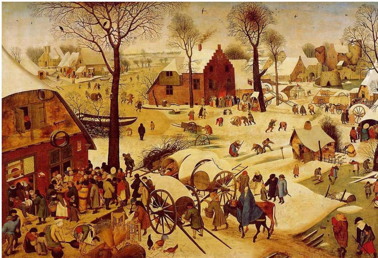
Pieter Bruegel: Betlehemi népszámlálás