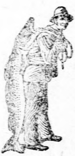
Az Emulsio vásárlásánál a SCOTT-féle módszer védelmét — a használatát — kérjük figyelmébe venni

kölesönöz a SCOTT, mint-ha varázssital lenne. De még több örömet okoz a szülőknél, ha a csecsemő megszületik, mert egészséges színében és erős formában a szülő különösen gyönyörködnek. Ez onnan van, mert az anya által bevett SCOTT-féle Emulsio a gyermeket is táplálta s erősítette, szóval mindkettőre a legkellemebb hatást gyakorolta.