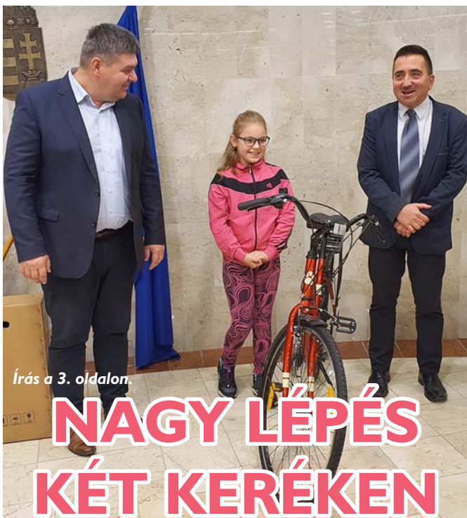
Írás a 3. oldalon.