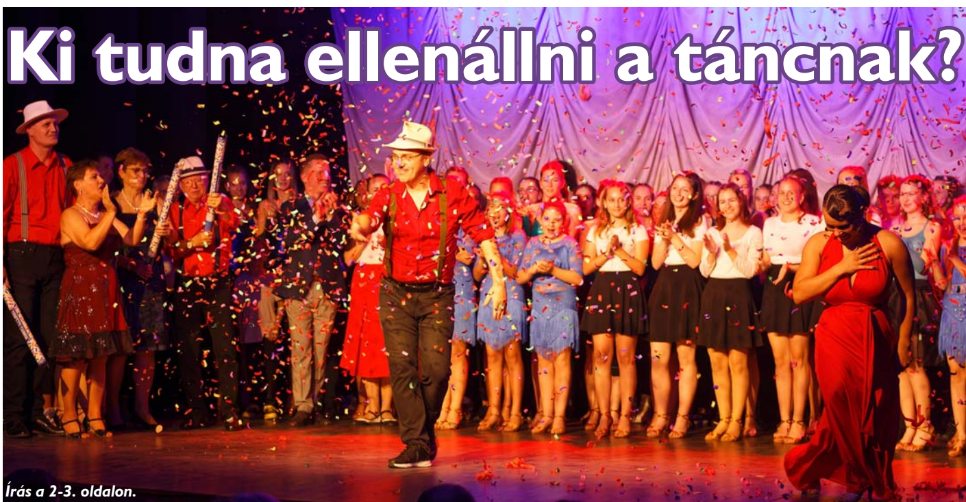
Írás a 2-3. oldalon.