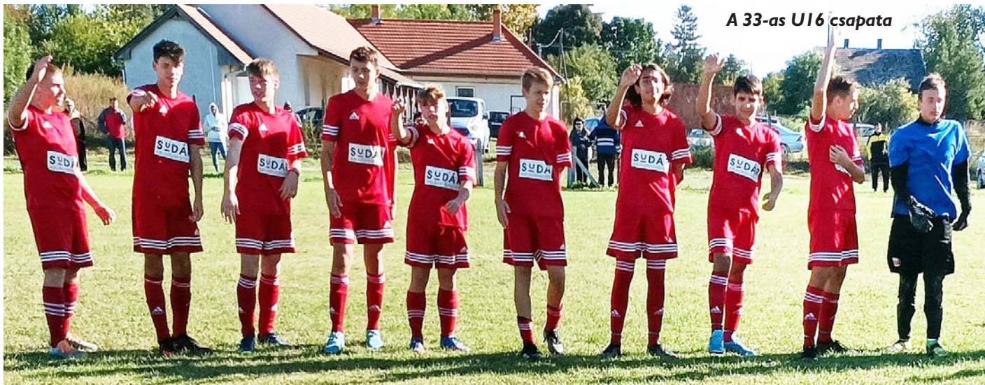
A 33-as U16 csapata

A hétvégén szombatra két hazai pályás és egy abai találkozóra, vasárnap pedig négy idegenben lejátszott mérkőzésre került sor. Az U19-es csapat a regionális bajnokságban szenvedett vereséget hazai környezetben az Iváncsa csapatától. A kapu előtti határozatlanság háromgólos vereséghez vezetett. Az Öregfiúk az első félidőben még azt is megengedték, hogy a Pusztaszabolcs forduljon vezetéssel a második félidőre. A szünet utáni helyzetkihasználás magabiztos győzelmet eredményezett. Az utánpótláskorúaknál az U15 Abán vendégszerepelt és begyűjtötte a három pontot. Az U13 baracsi vendéglátékán nem sikerült a pontszerzés. Az U16 csapata Cecén beállította az eddig tartott gólcúcsot: a 33 gólos győzelem önmagáért beszél. A női csapat Enyingen igyekezett pontot szerezni és a betegségek, sérülésektől megtizedelt együttes célja a tisztes helytállás volt. A felnőttek az újonc Csőr csapatához utaztak és magabiztos győzelmet arattak a sáros pályán, esélyt sem adva a hazaiaknak.