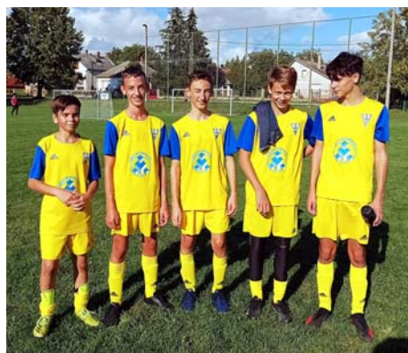
Az abai hatgólos ötösfogat