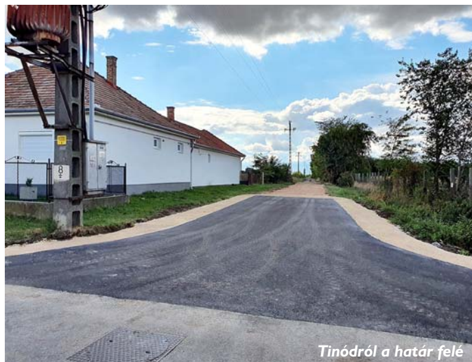
Tinódról a határ felé

tudva a gond e kátyúkról a telibe aszfaltozás pozitív következményeként.