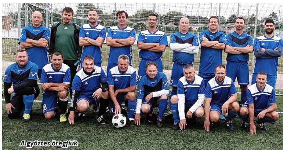
A győztes öregfiúk