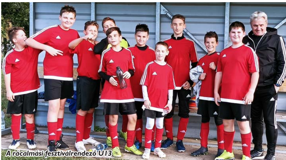
A rácalmási fesztiválrendező U13

Sárbogárd: Darvas – Csuti, Kaló, Szigeti, Szalai, Somosi, Király, Csajági, Holló Csere: Deák