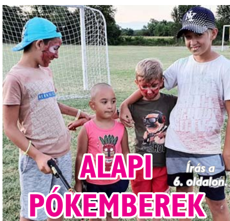
Írás a 6. oldalon.