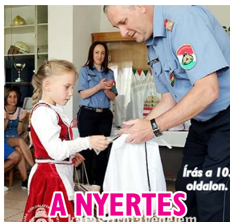
Írás a 10. oldalon.