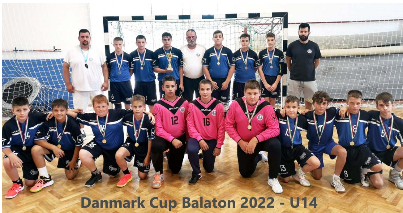
Danmark Cup Balaton 2022 - U14