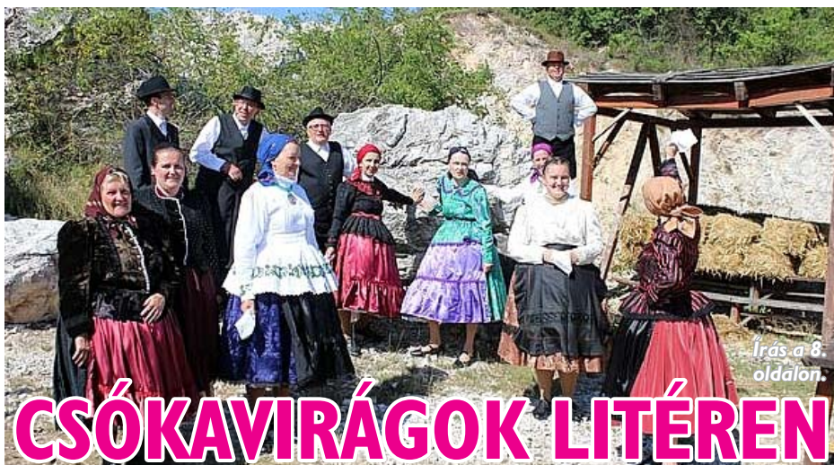
Írás a 8. oldalon.