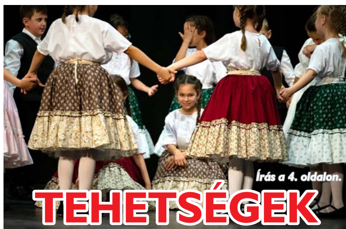
Írás a 4. oldalon.