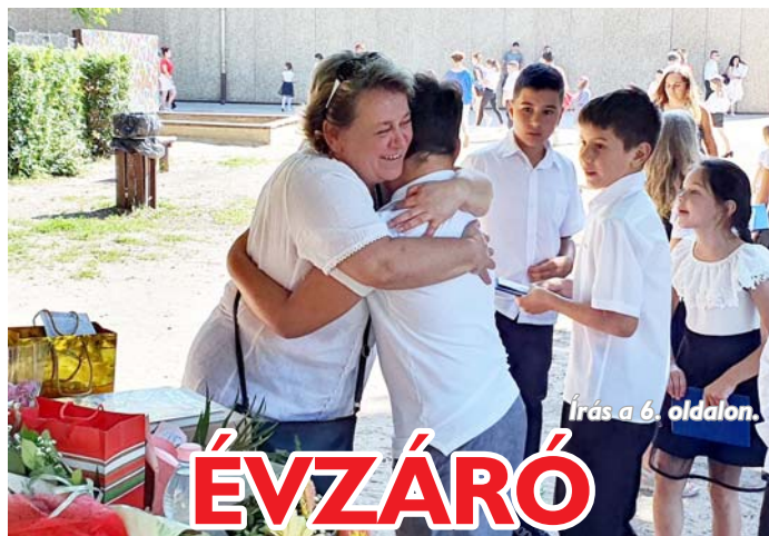
Írás a 6. oldalon.