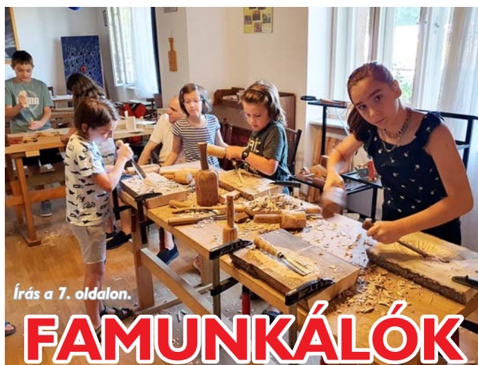
Írás a 7. oldalon.