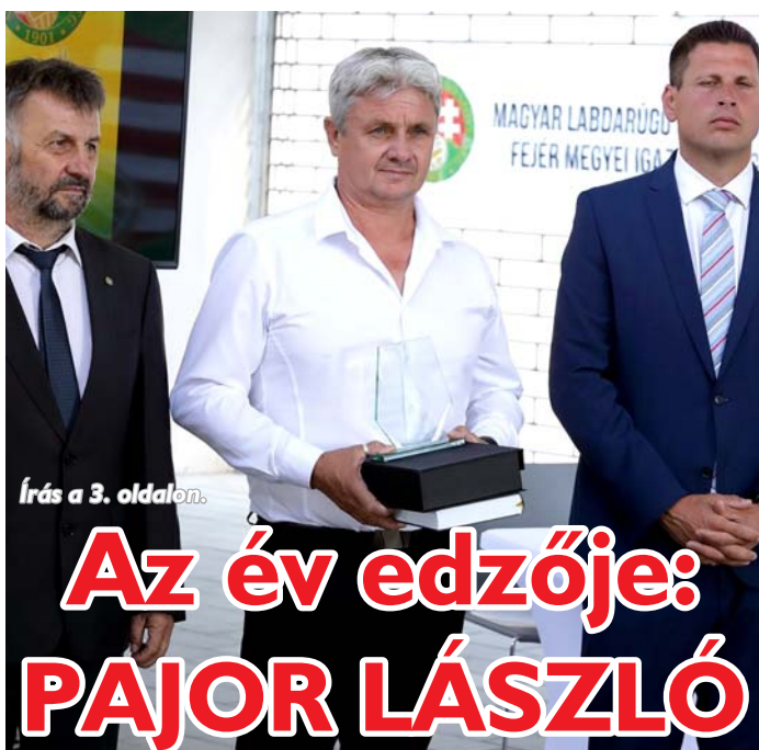
Írás a 3. oldalon.