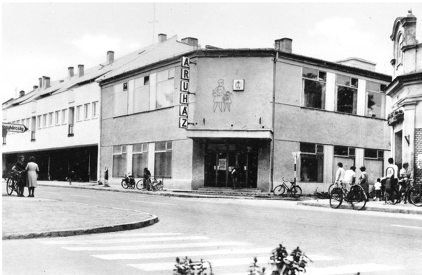
Az áruház a nyolcvanas években és 2022-ben