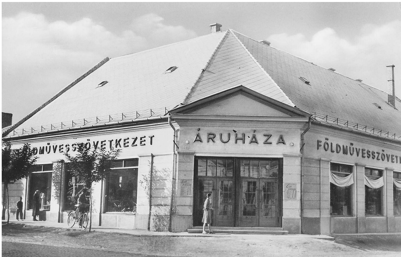
Az áruház az ötvenes években