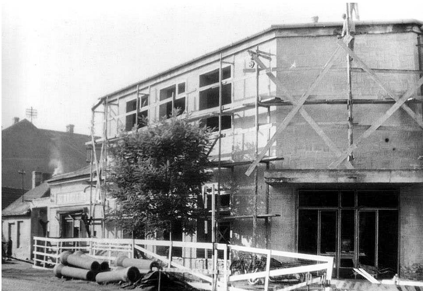
Az áruház átépítése