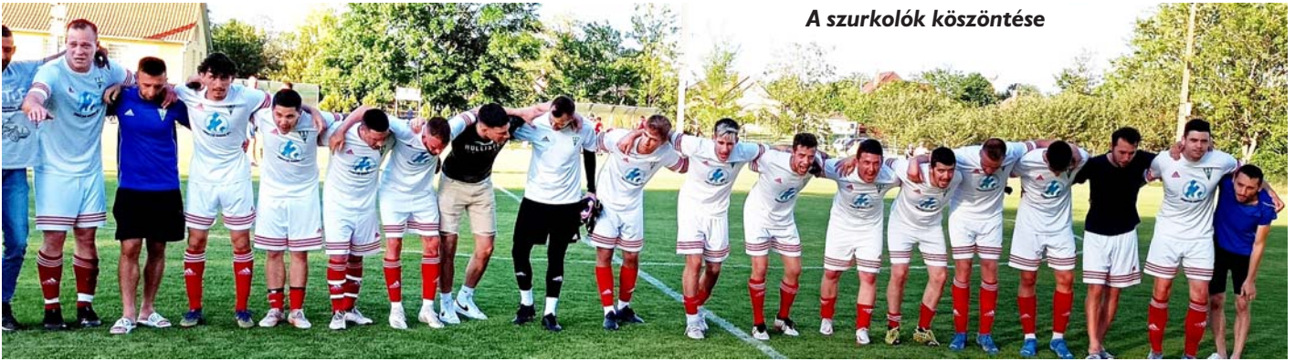
A szurkolók köszöntése