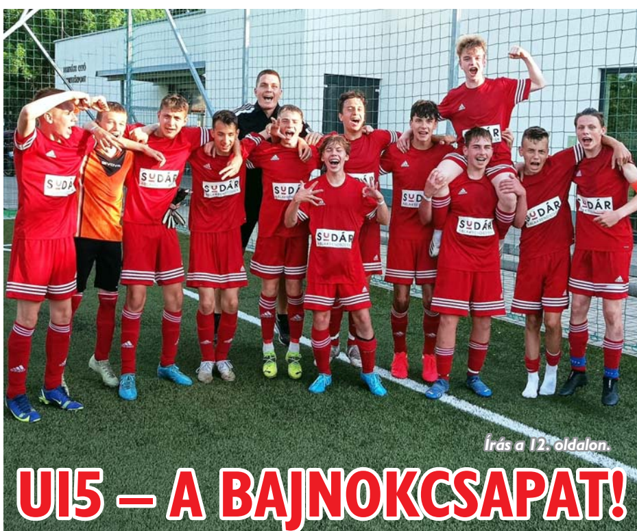
Írás a 12. oldalon.