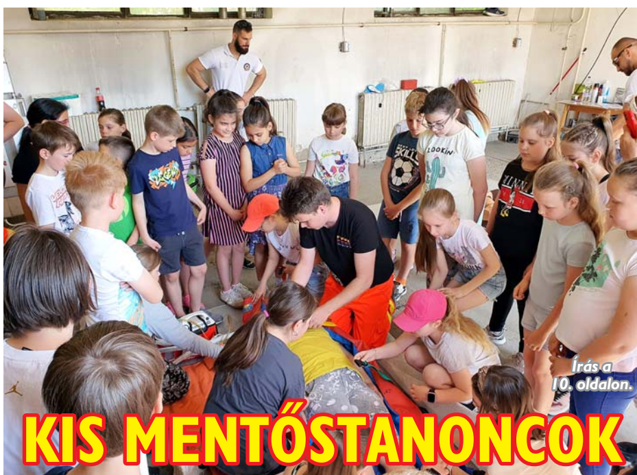
Írás a 10. oldalon.