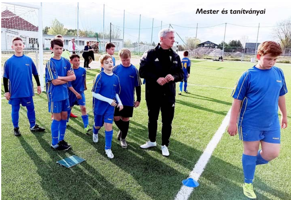
Mester és tanítványai