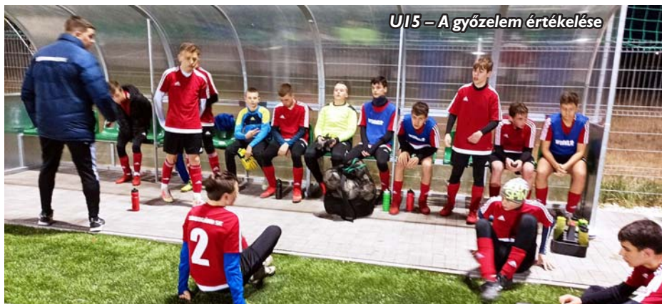
U15 – A győzelem értékelése