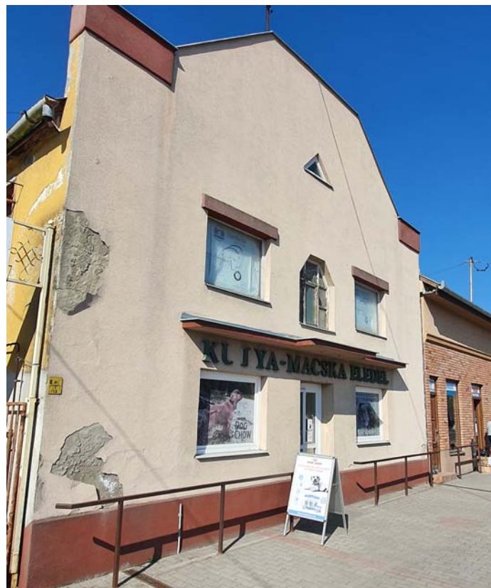
Régen: Árpád mozi a dolgozókkal 1965-ben, ma állateledelbolt