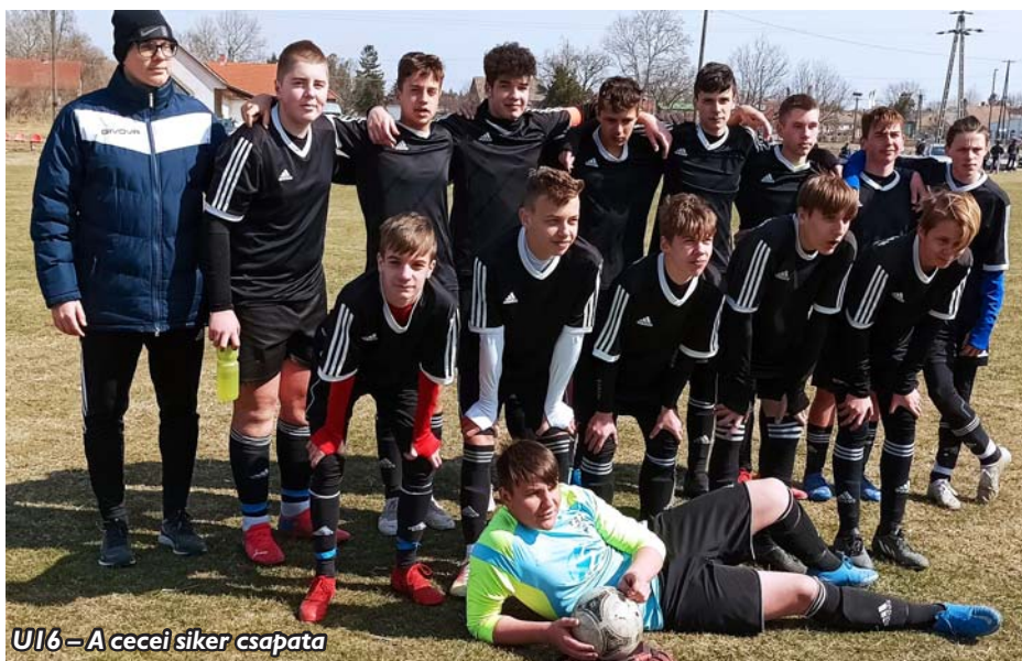
U16 – A cecei siker csapata

További eredmények: Sárosd U16–Enying U16 1-6, Lajoskomárom U16–Kisláng U16 2-10