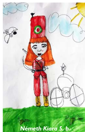
Németh Kiara 5. b